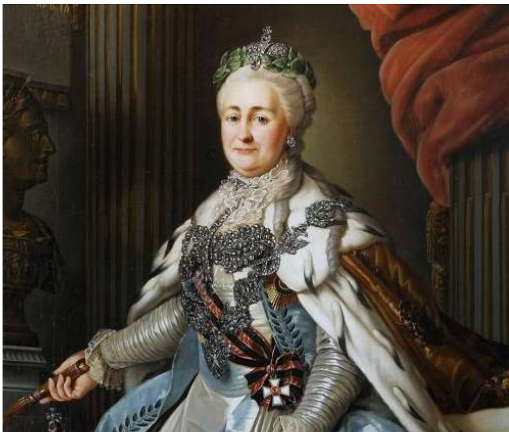
Екатерина Вторая Великая